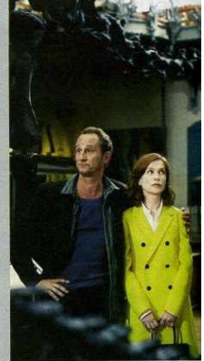
B. Poelvoorde et I. Hupper Mon pire cauchemar