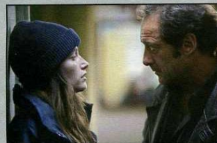
V. Lindon et M. Gillain - Toutes nos envies