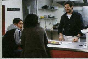
Guillaume Canet - Une vie meilleure