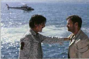
Y. Attal et C. Cornillac - Dans la tourmente