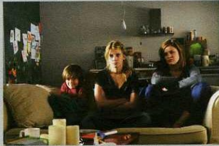
Mélanie Laurent - Les adoptés