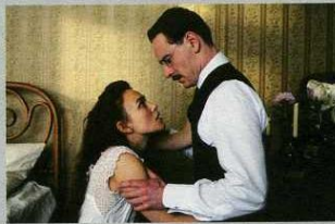
K. Knightley et M. Fassbender - A dangerous method

Événement de dimension internationale, le Festival d'Arras a imposé son style et sa singularité pour s'inscrire comme le rendez-vous incontournable de l'automne. Chaque année en novembre, pendant 10 jours, il réunit le grand public, les cinéphiles et les professionnels du cinéma autour d'une sélection de films qui associe l'émotion, la réflexion et le divertissement. Depuis 2000, les plus grands noms du cinéma sont accueillis Arras dans le cadre d'hommages et de rétrospectives. Retrouvez tous ces films lors du festival du 4 au 13 novembre.