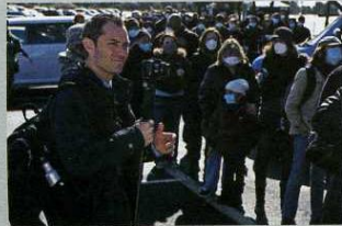
Jude Law - Contagion